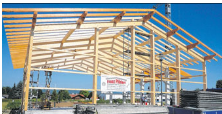
Echte Handwerkskunst präsentiert sich auch beim Bau der eigenen Werkshalle im Dießener Gewerbegebiet.