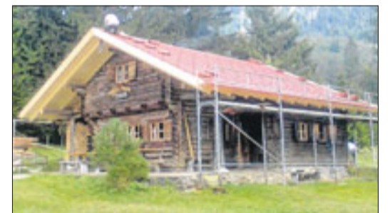
Erst vor kurzem wurde der Dachstuhl der Dießener Hütte in Farchant vom Pföderl-Team erneuert.

Oder besuchen Sie die Zimmerei Pföderl im Internet unter: www.zimmerei-pfoederl.de